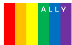
ALLYステッカーを配布します。

土曜開催ですので、学生さんや若い世代の方はもちろん、すべての世代の方に、聞いていただきたい内容です。